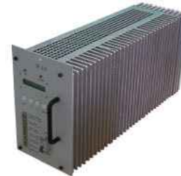
IP 1.8 INTELLIGENT POWER